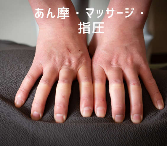
あん摩・マッサージ・指圧

チラシご持参or当院Instagramをフォロー頂いた方は初診料¥1000サービス！ ※2回目以降の患者様は10分延長とさせていただきます